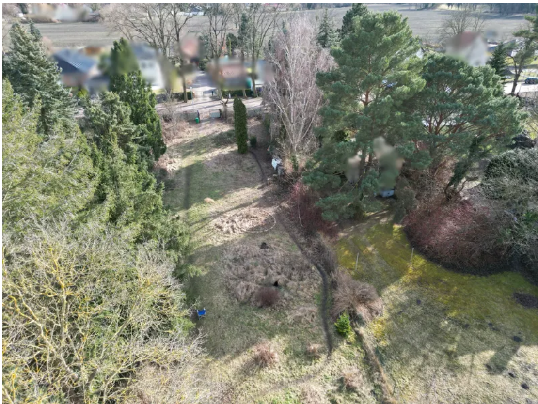
Grundstück von oben 2