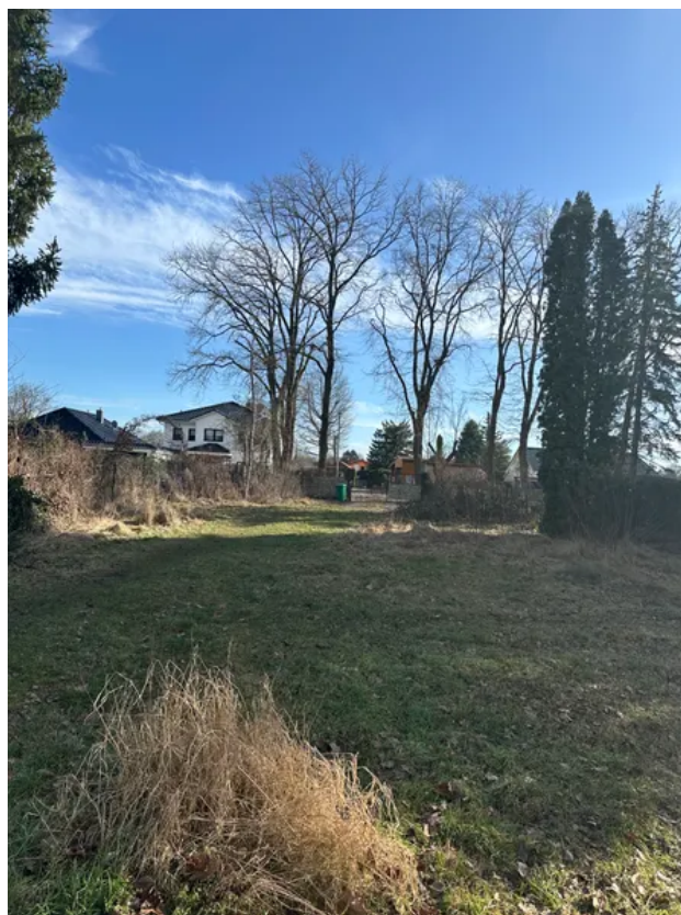
Grundstück Blick nach vorne